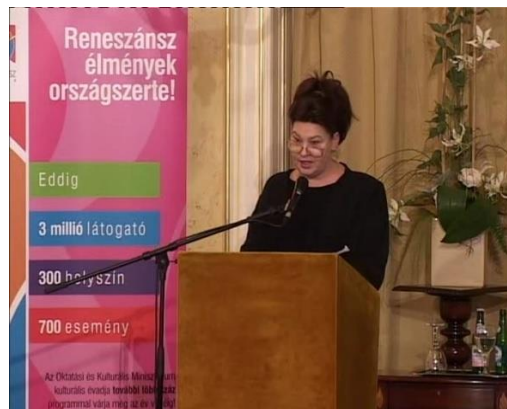
Bánffy Edit közreműködése.

Anna intuitív lélekelemzése és az általam előadott József Attila-versek, önvallomásai több évre szóló, máig tartó munkakapcsolatot és barátságot eredményeztek.