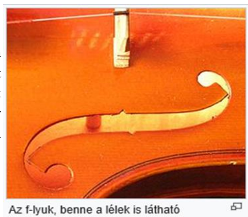
Az f-lyuk, benne a lélek is látható

„ Lélek: A vonós hangszerek belsejében (mint pl. a hegedű) található a lucfenyőből készült kis hengeres pálcika, melynek neve: lélek . A lélek nincs rögzítve, ha eltávolítjuk, akkor a hangszer teljesen megnémul és minden rezgési energia megszűnik.”